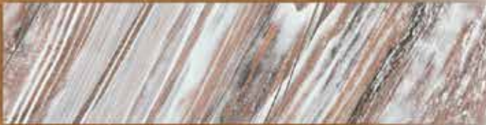
[ลายหินอ่อน แมคซิอาโต]