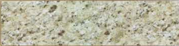
[ลายหินอ่อน เยลโล่ บราซิล]