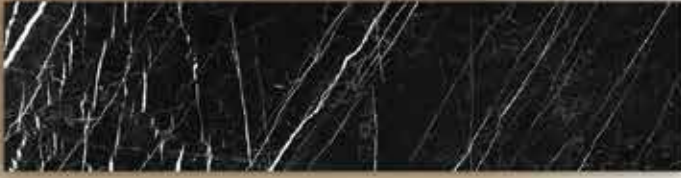
[ลายหินอ่อน เบล็ก เพิร์ล]