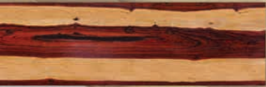
[ลายไม้พะยูง สีสรรมาติ]