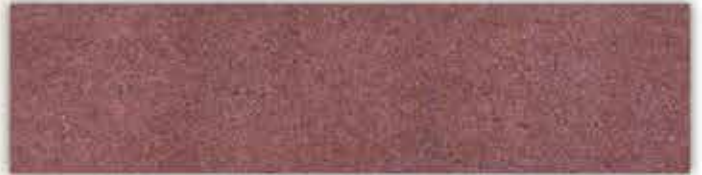
[ลายหินอ่อน แอซเทค เรด]