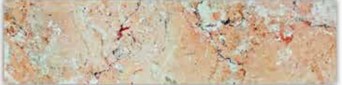
[ลายหินอ่อน ออเรนจ์ शेด]