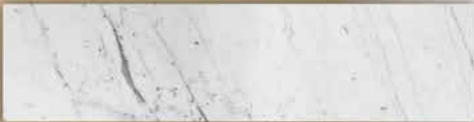
[ลายหินอ่อน แอนตาร์กติกา ไวท์]