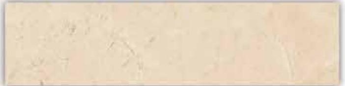
[ลายหินอ่อน คาราเมล ครีม]