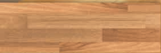
[ลายไม้คาราเมล คาราเมล]

ด้วยมิติใหม่แห่งการผลิตที่ก้าวล้ำกว่าเดิม ทำให้เกิดเป็นแผ่นลามิเนตที่แกร่ง แลทนทานกว่าลามิเนตทั่วไป ด้วย Fiber Cement Body ที่ทนต่อแรงกด แรงกระแทกได้สูงสุด แลระบบการพิมพ์ลดสาย Digital คุณภาพสูง ที่ทำให้สามารถ Lock สีเข้าไว้กับแผ่นไม้ได้อย่างแน่นหนา ป้องกันการหลุดลอกของสีได้อย่างมีประสิทธิภาพ นอกจากนี้แผ่น TPI Laminate ยังสามารถลดรอยต่อระหว่างแผ่นไม้ ทำให้ลดสายมีความต่อเนื่องสวยงามไร้จุดสะดุดทุกตารางนิ้ว