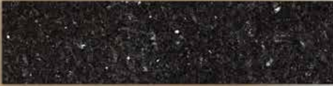
[ลายหินอ่อน เบล็ก เอมมัลด์]