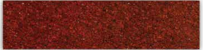
[ลายหินอ่อน อินเดียน่า โรส]