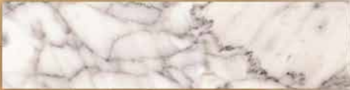
[ลายหินอ่อน มาร์โมอร์]