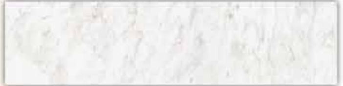
[ลายหินอ่อน ไวท์ เพิร์ล]