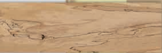
[ลายไม้วีก์ เมเปิ้ล]