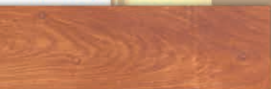
[ลายไม้โมคา มอคา]