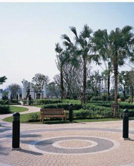
GT-100 , GB-100 , GF-101 ไทเทิร์น , เครื่องหมายตัว