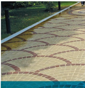
GT-100 , GB-100 , GF-101 (ลายพัด) ธรรมชาติ , ๓๓๘