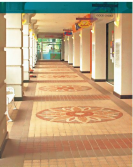
ลายดอกบัว GT-100,GB-100,GF-101,GF-201 ธรรมชาติ,ทอง,ไทเทิร์น